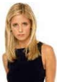
Buffy Anne Summers.

Buffy é hoje ma garota de 23 anos , ciente de sua missão no mundo e em relação a seus amigos. Ela teve tudo e foi obrigada a largar devido ao fato de ser ma caçadora. Nascida em uma família estável ela nunca achou que sua vida passaria por tantos transtornos. Desde uma irmã surqida do nada a morte de sua mãe e a uma